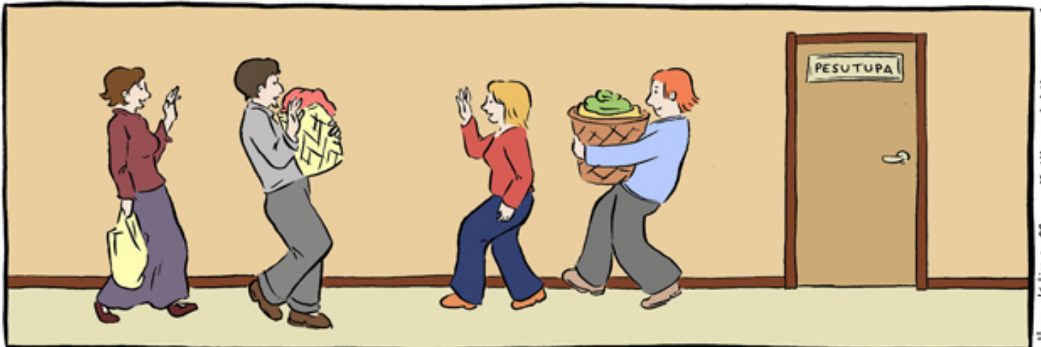
ja siivoa myös jälkesi